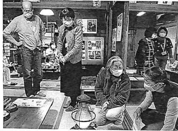
ストーブを囲んで